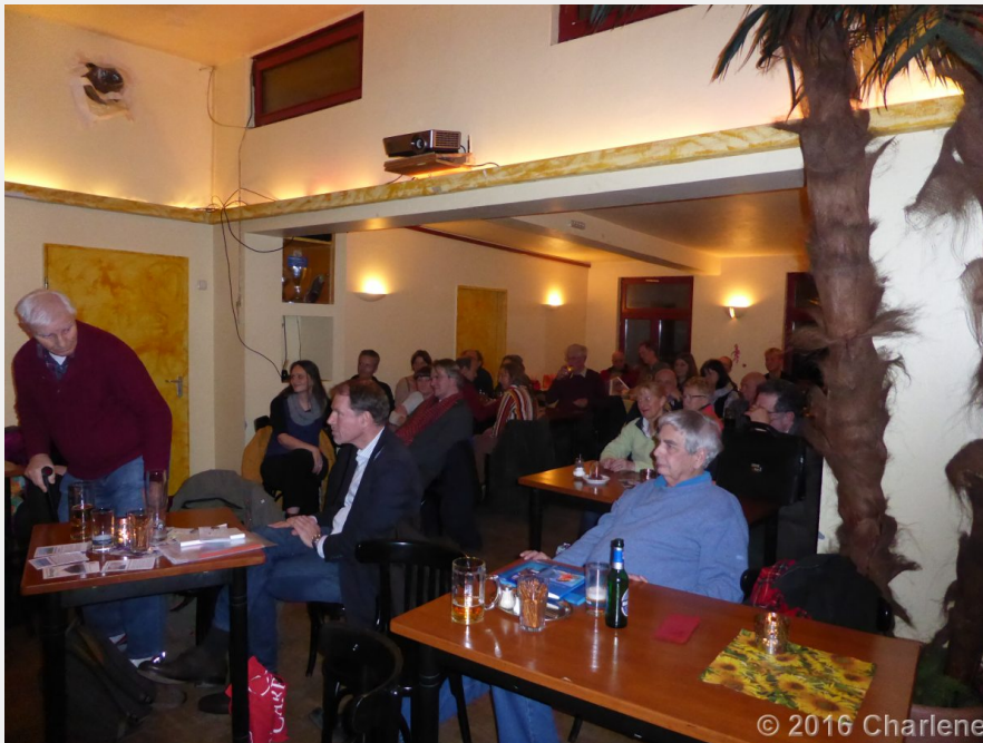
Das TextLabor ist sehr gut besucht

Als ich den hinteren Raum des BeLaMi betrete, traue ich meinen Augen nicht. Fast alle Plätze sind diesmal besetzt, und es kommen immer noch weitere Besucher. Meine Pressemitteilung war abgedruckt worden, sogar mit Foto.